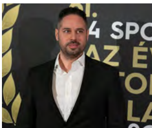
Jelölő szervezet: Magyar Paralimpiai Bizottság