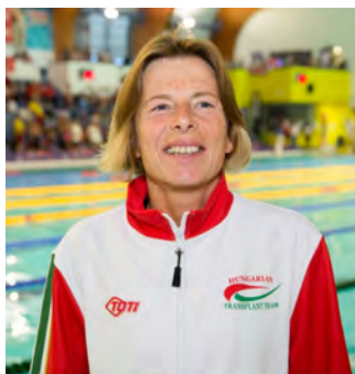
Jelölő szervezet: Magyar Szervátültetettek Szövetsége