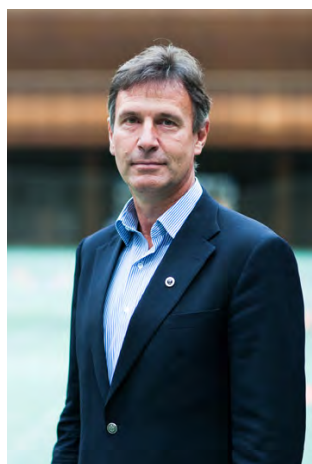
Jelölő szervezet: Magyar Paralimpiai Bizottság