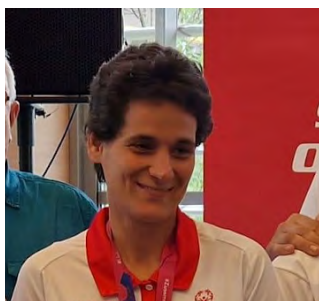
Jelölő szervezet: Magyar Speciális Olimpia Szövetség