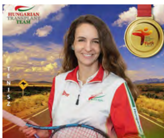
Jelölő szervezet: Magyar Szervátültetettek Szövetsége