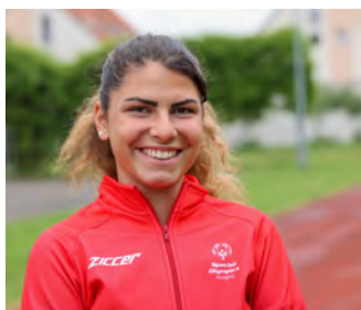
Jelölő szervezet: Magyar Speciális Olimpia Szövetség

Hazánk egyik legsikeresebb paraúszója az idei évben is sziporkázott. A tokiói Magyar Paralimpiai Csapat legsikeresebb sportolója, immáron az ELTE jogi karának hallgatójaként, kimagasló elszántsággal készült az idei évre. A Vasas SC paralimpiai bajnoka ebben az évben a manchesteri világbajnokságon gyarapította érempalettáját: 400 méter gyorson és 100 méter háton is megvédte világbajnoki címét, valamint 200 méteres vegyesúszásban is aranyérmet szerzett, emellett 100 méter gyorson bronzérmesként csapott célba. Ezen eredményeinek köszönhetően egy országkvótával is megörvendeztette a Magyar Paralimpiai Csapatot a jövő évi játékokra.