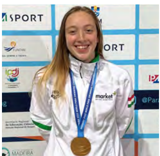
Jelölő szervezet: Magyar Paralimpiai Bizottság