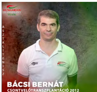
Jelölő szervezet: Magyar Szervátültetettek Szövetsége