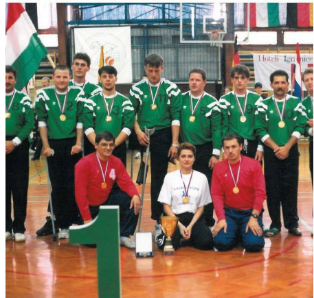
1995. ljubljana-i Európa-bajnokság: aranyérmert szerzett ülőröplabda csapatunk.