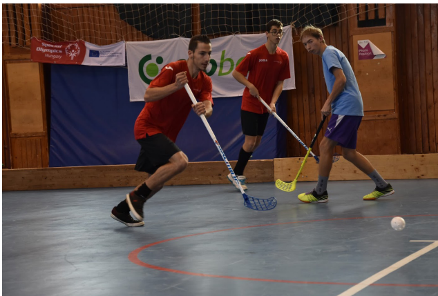
A floorball a Magyar Speciális Olimpia Szövetség legújabb, 22. sportága. Reményeink szerint, népszerű lesz az integrált - értelmi fogyatékosággal élő és ép értelmű diákok alkotta - csapatok körében.